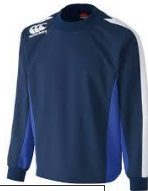
プルオーバータイプのトレーナー (上からかぶって着ることができる)