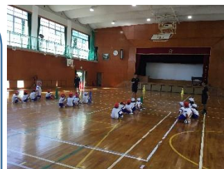
サンガつながり隊

尚、辞退権があるのは、本校での「PTA 本部役員経験者」に限ります。また、選挙の対象は5年生児童家庭ですが、立候補は1～4年生家庭も対象となります。